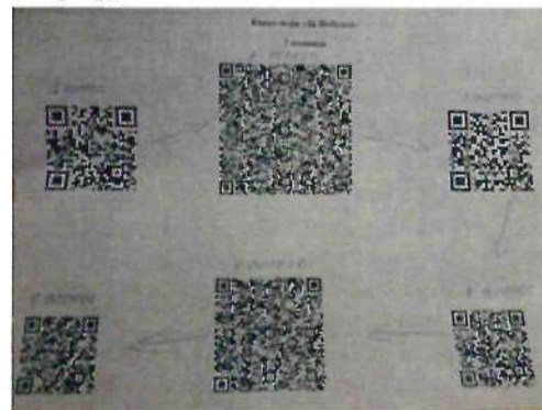
Маршрутный лист для 2 команды