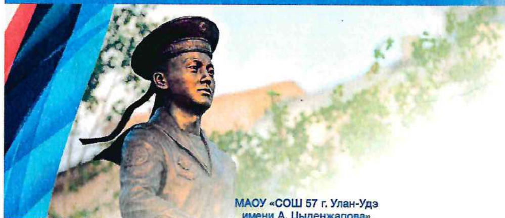
МАОУ «СОШ 57 г. Улан-Удэ имени А. Цыденжапова»

Министерство спорта и молодежной политики Республики Бурятия МУ «Комитет по образованию Администрации г. Улан-Удэ»